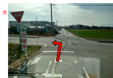
⑩ 広い道路(県道108号線)に出たら左折