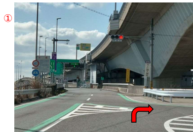
① 伊勢湾岸道「弥富木曾岬IC」信号曲がる