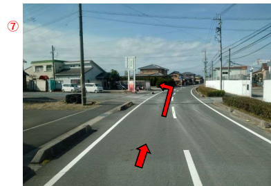
⑧ カラオケ喫茶を過ぎたら左折