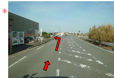
⑦ 左側にあるタバコ店(自販機数台あり)を過ぎて左折