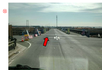
⑫ 鍋田川(新緑風橋)を過ぎれば、左前方に当社が見えてきます