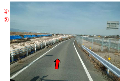
② ③ 県道103号線