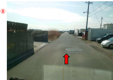
⑨ しばらく直進(約900m、まわりは田・畑)