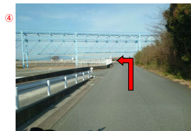
④ 青い鉄骨の高架橋(クレーン)をくぐったら左折